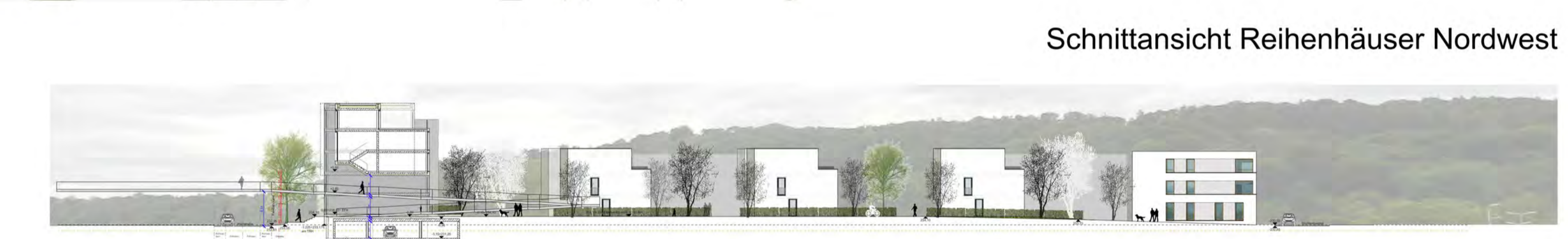
Schnittansicht Reihenhäuser Nordwest