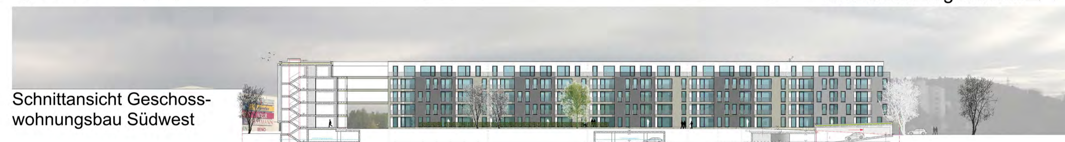
Schnittansicht Geschoss- wohnungsbau Südwest