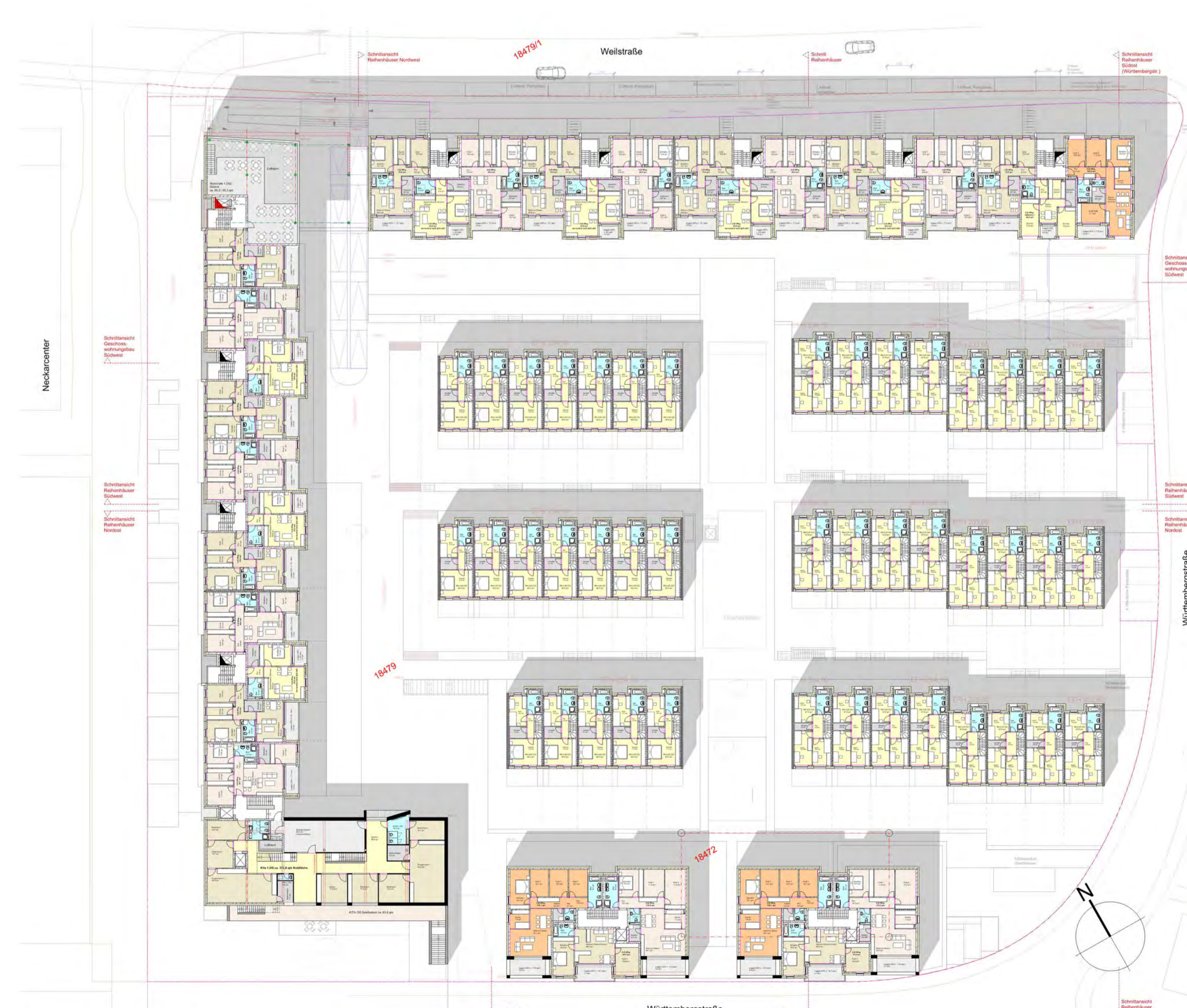
Grundriss 1. Obergeschoss