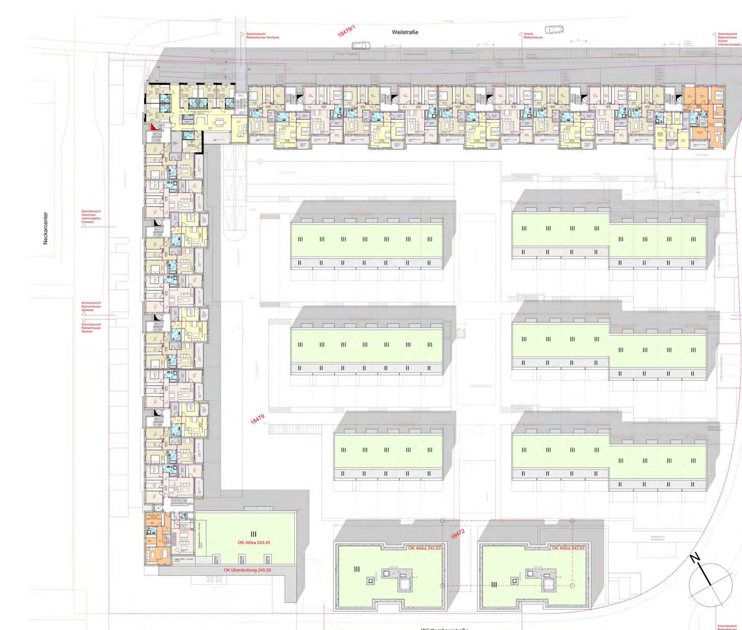
Grundriss 3. Obergeschoss