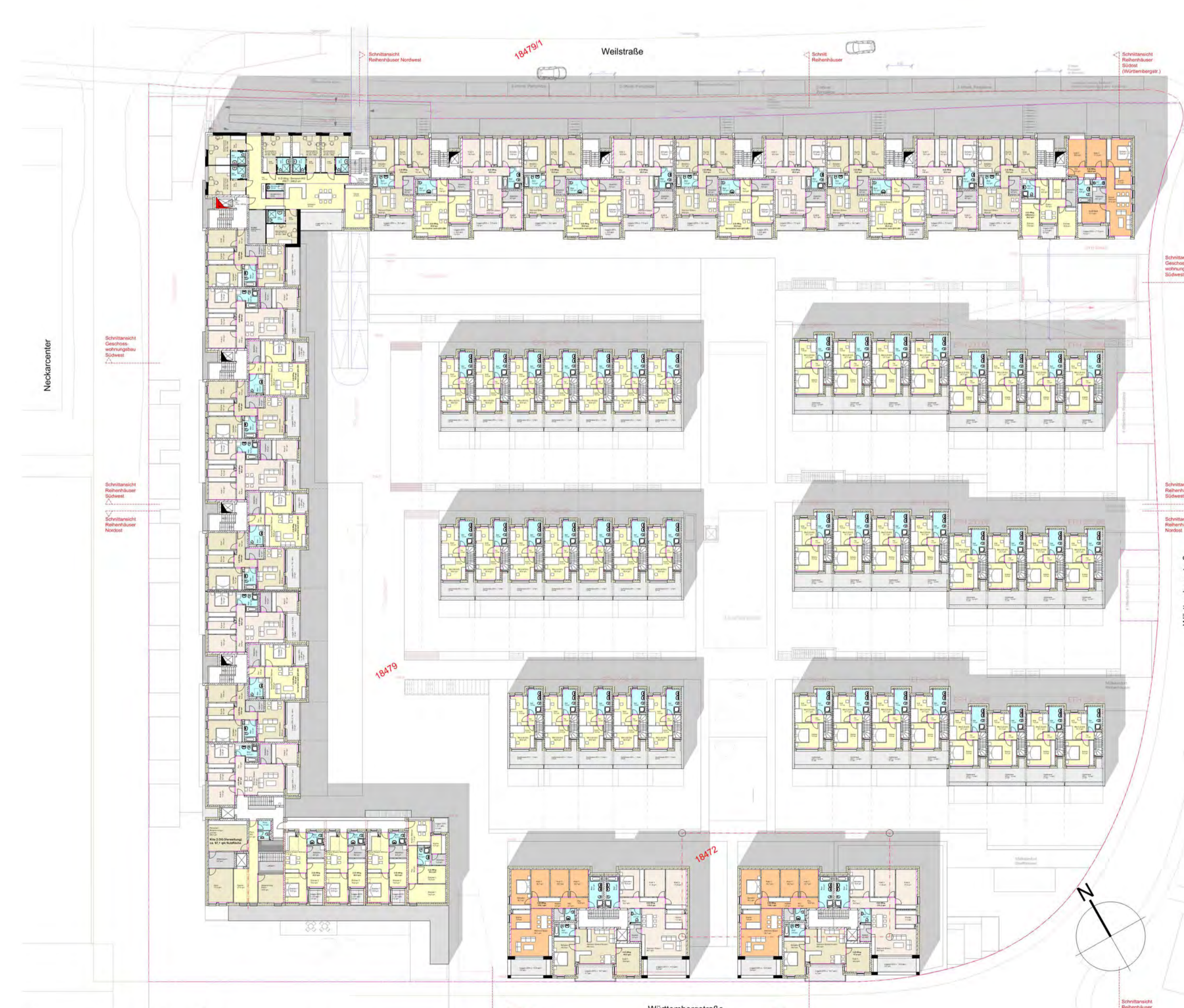
Grundriss 2. Obergeschoss