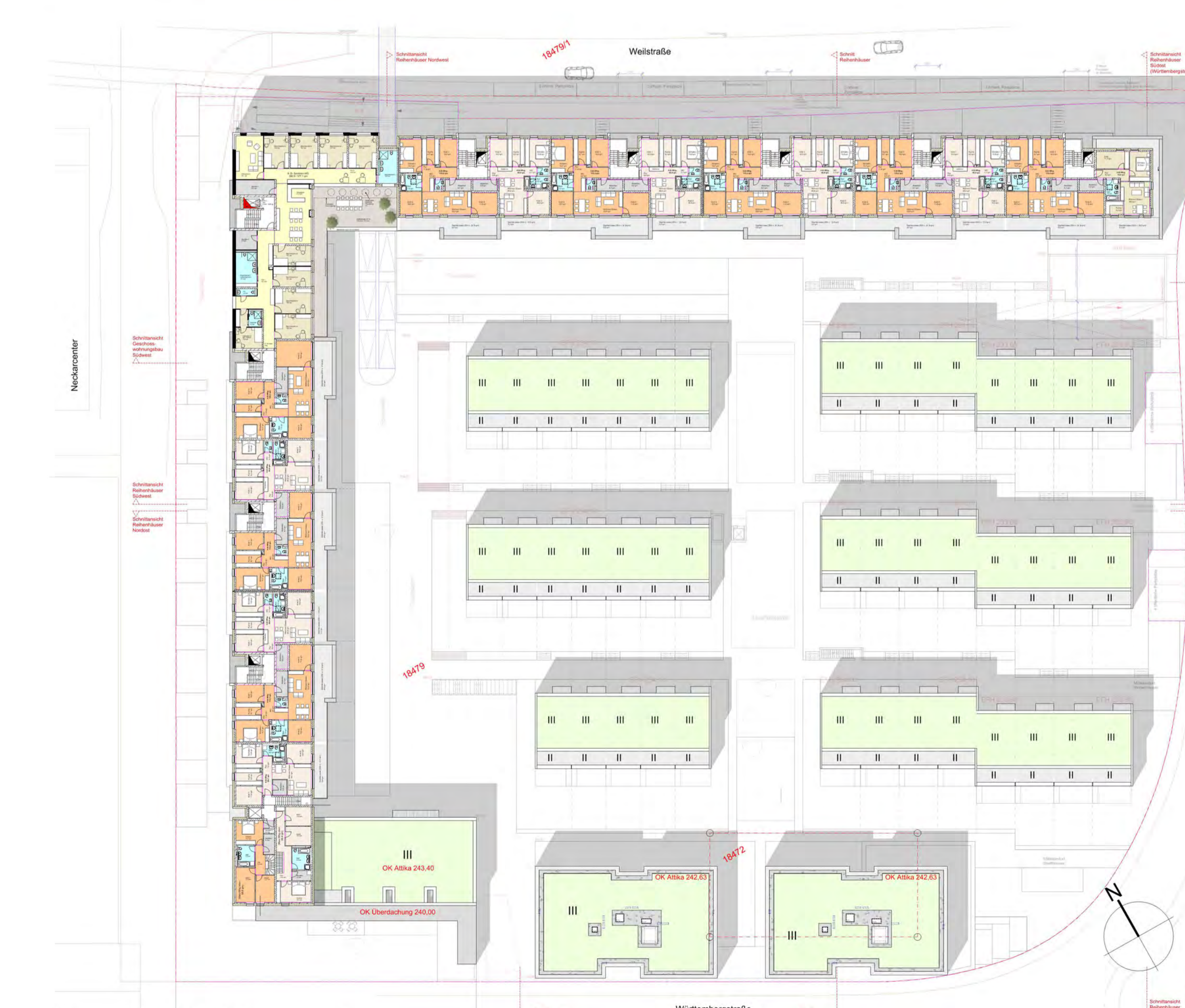
Grundriss 4. Obergeschoss