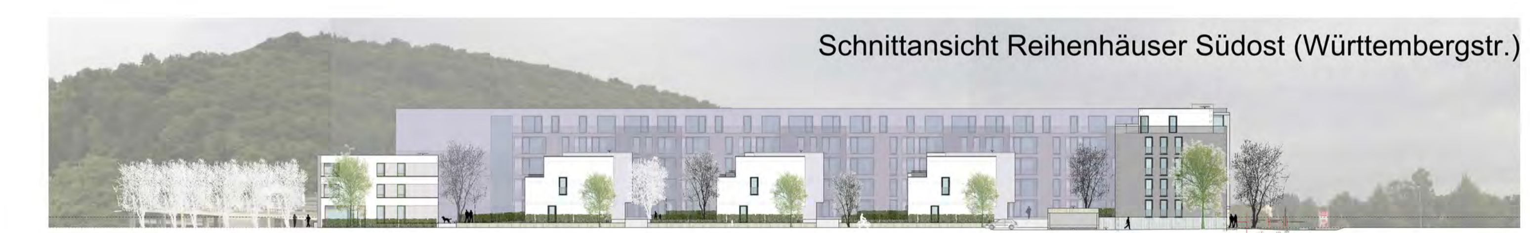
Schnittansicht Reihenhäuser Südost (Württembgerstr.)