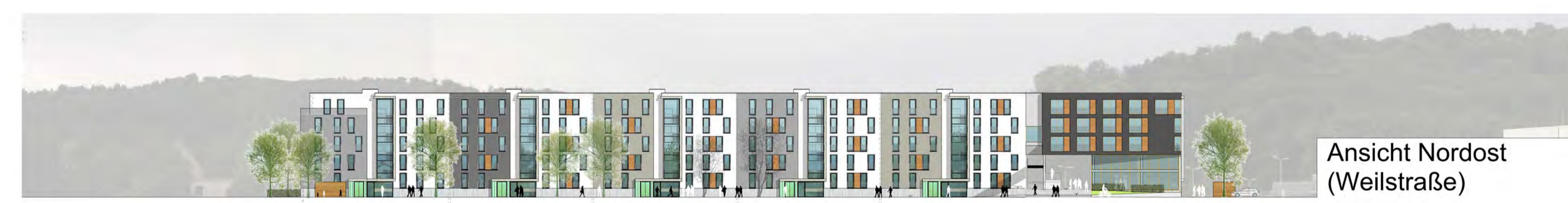
Ansicht Nordost (Weilstraße)