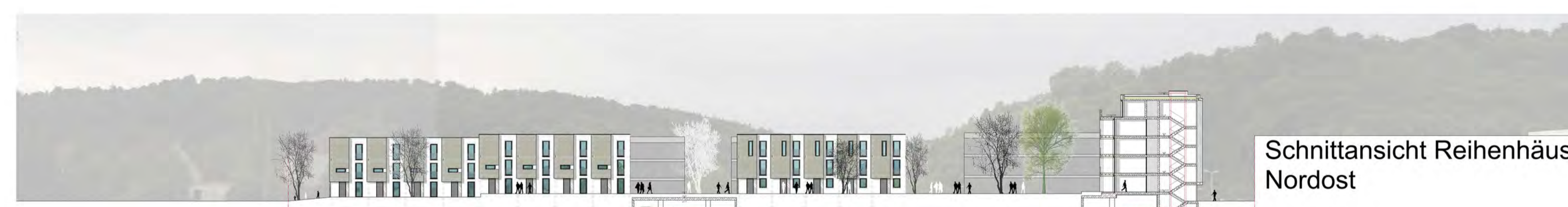
Schnittansicht Reihenhäuser Nordost