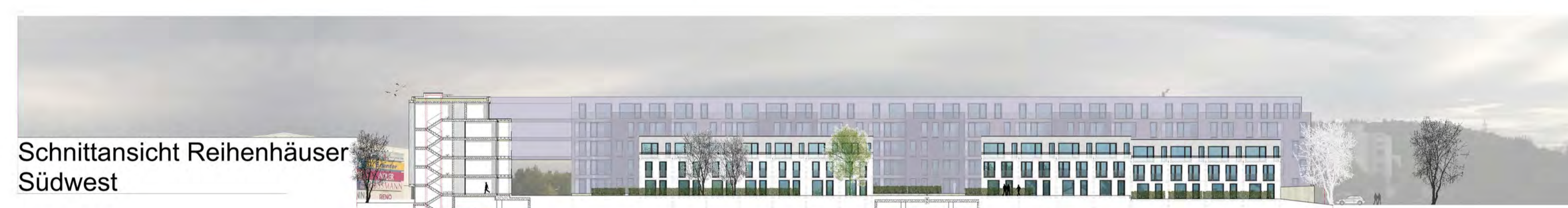
Schnittansicht Reihenhäuser Südwest