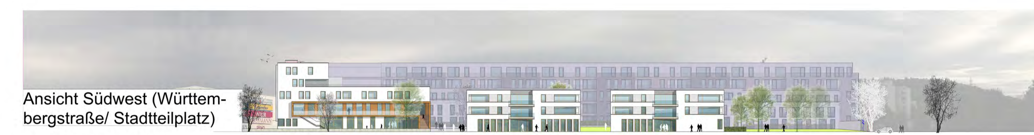
Ansicht Südwest (Württem- bergstraße/ Stadtteilplatz)